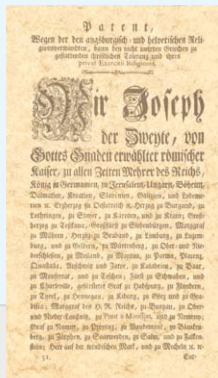
Pierwsza strona Patentu tolerancyjnego cesarza Józefa II z 1781 r.

Zapraszamy Czytelników do współredagowania tej strony. Prosimy o nadsyłanie ciekawostek związanych z Cieszynem (np. anegdot, przepisów kulinarnych, zdjęć, dokumentów, wzorów rękodzieła artystycznego itp.), które mogłyby zainteresować innych i wzbogacić wiedzę o naszym mieście. Gwarantujemy zwrot wszystkich otrzymanych materiałów.