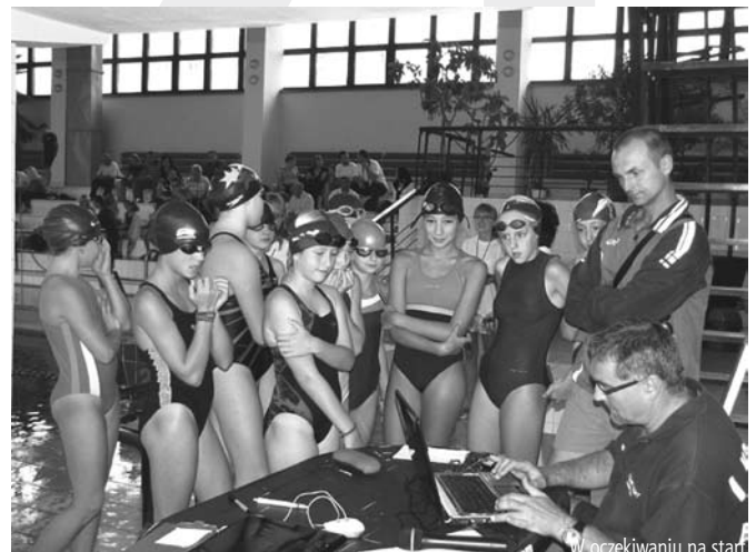
W oczekiwaniu na start