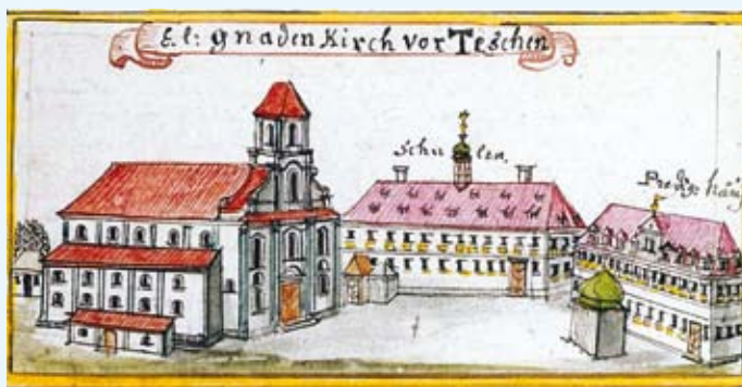
Plac Kościelny po 1709 roku, rysunek J. B. Wernera