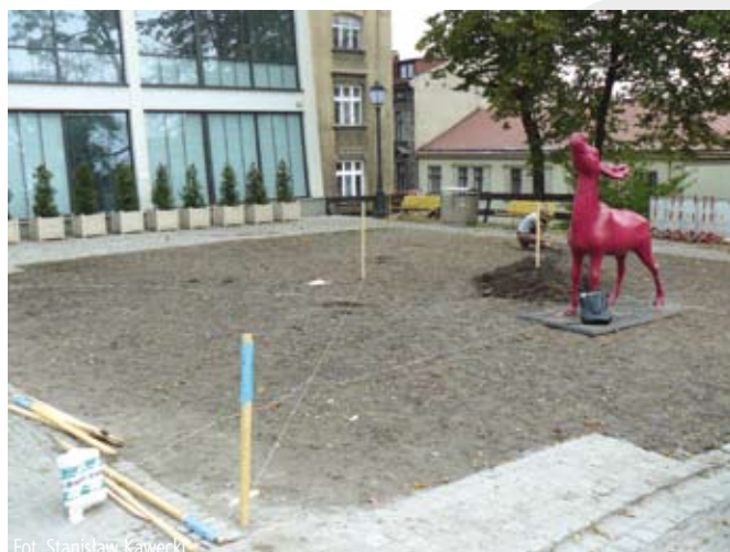
Nowe zagospodarowanie terenu wokół budynku administracyjnego Zamku