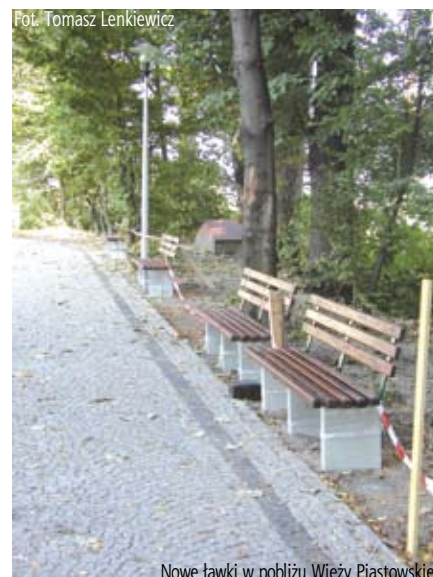
Nowe ławki w pobliżu Wieży Piastowskiej

Projekt współfinansowany przez Unię Europejską z Europejskiego Funduszu Rozwoju Regionalnego w ramach Programu Operacyjnego Współpracy Transgranicznej Republika Czeska – Rzeczpospolita Polska 2007-2013 http://www.cz-pl.eu