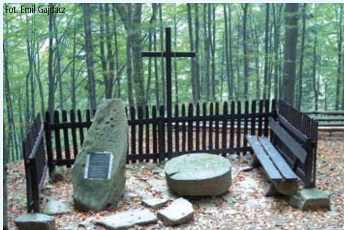
Leśna świątynia pod Równicą

Teskt pochodzi z ulotki pt. „Szlakiem pamiątek ewangelików cieszyńskich” wydanej przez Biuro Promocji i Informacji UM. Można ją bezpłatnie otrzymać w Cieszyńskim Centrum Informacji (Ratusz, parter)