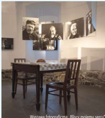
Wystawa fotograficzna „Bliscy mojemu sercu”

Już po raz dziewiąty Śląski Zamek Sztuki i Przedsiębiorczości, we współpracy z Ośrodkiem Kultury KaSS Strzelnice z Czeskiego Cieszyna oraz instytucjami kultury obu przygranicznych miast miały zaszczyt zaprosić na „Skarby z cieszyńskiej trówały”. Program jak co roku był ciekawy i zróżnicowany, łączący sztukę współczesną z historią i tradycją Śląska Cieszyńskiego. W dniach 18–20 września zaprezentowano skarbnicę talentów oraz potencjał artystów i rzemieślników, lokalnych instytucji, a także organizacji pozarządowych zarówno z czeskiej jak i polskiej strony Olzy.