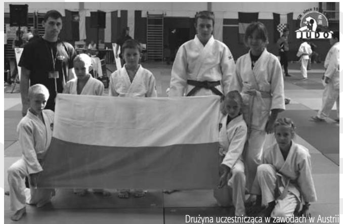
Drużyna uczestnicząca w zawodach w Austrii